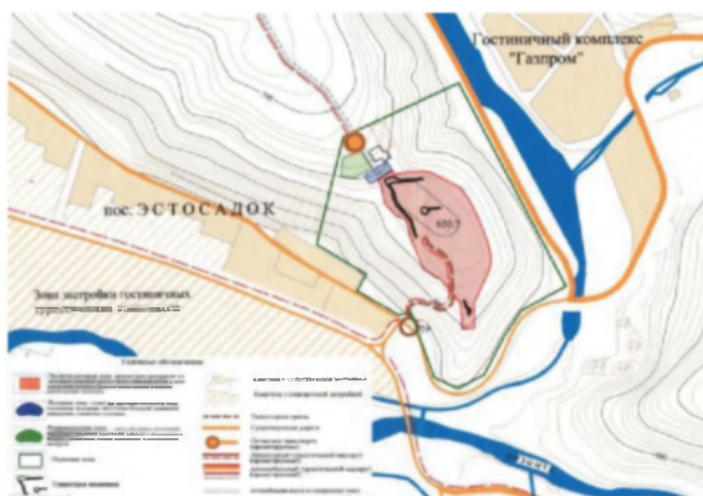
Рис. 1. Схема функционального зонирования территории, занимаемой Ачипсинской крепостью.

Также положительным моментом в деле музеефикации Ачипсинской крепости является ее расположение вблизи крупных туристских комплексов на окраине поселка Эсто-Садок. На окраине поселка возле моста через Мзымту, находится недавно построенный ресторан «Поляна», от которого ведет наверх туристическая тропа, которая выводит на городище. На другом берегу реки Ачипсе построен гостиничный комплекс компании «Газпром».