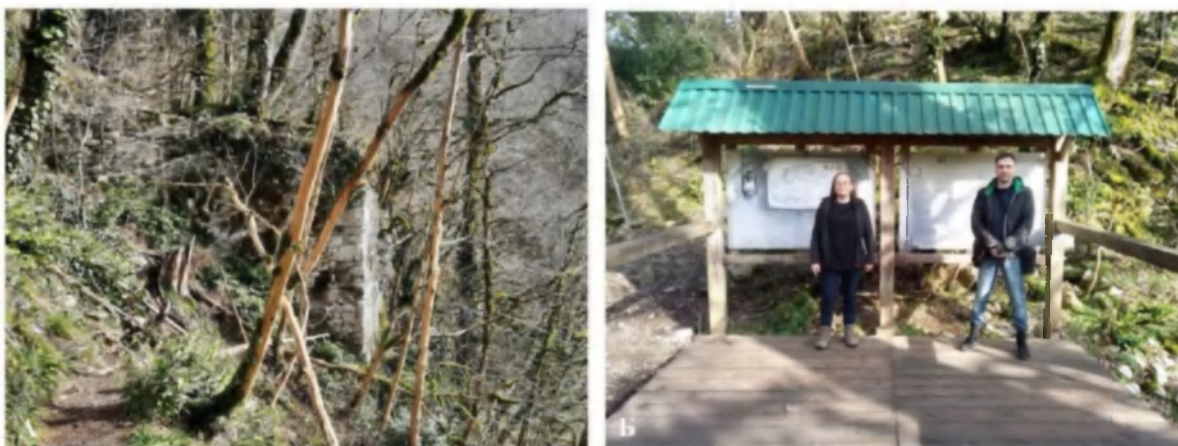
Рис. 3. Средневековая крепость на территории Тисо-самшитовой рощи: вид на сохранившуюся северо-западную башню крепости (А); научные сотрудники учреждений во время экспедиции на крепость (Б).

Подобная практика имеет перспективу дальнейшего продолжения совместной работы. Особенно это имеет отношение к району посёлка Красная Поляна, где ряд объектов оборонительного зодчества раннесредневекового периода находятся недалеко друг от друга, но принадлежат двум вышеназванным учреждениям.