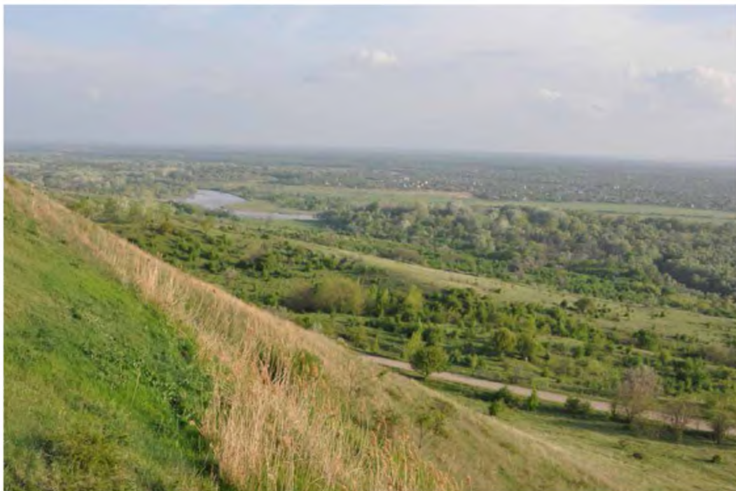
Пойменный лес в долине р. Кубани