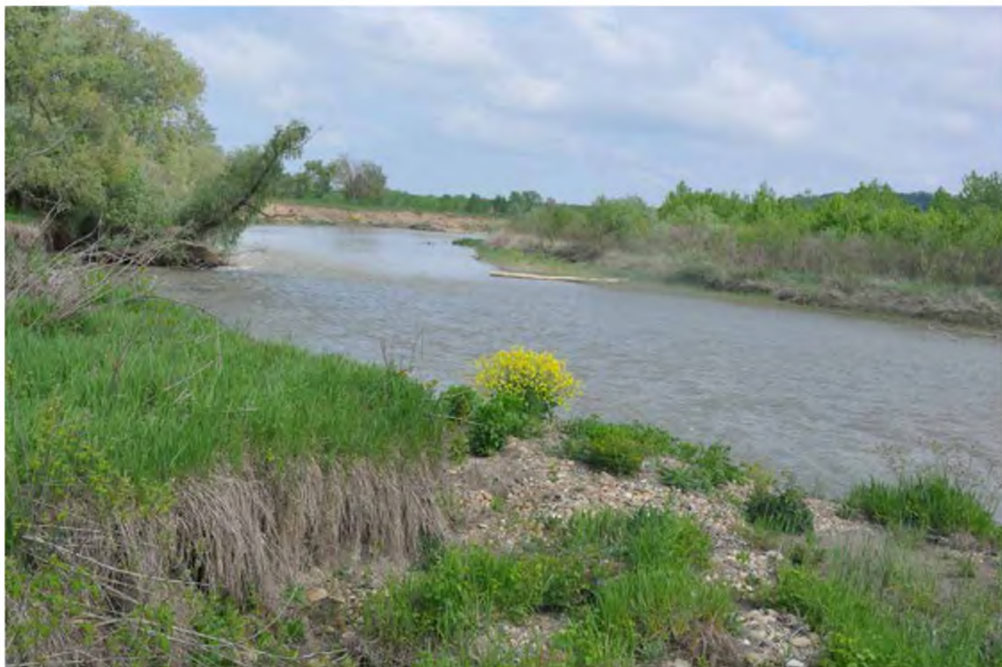
Приток р. Кубани — р. Уруп