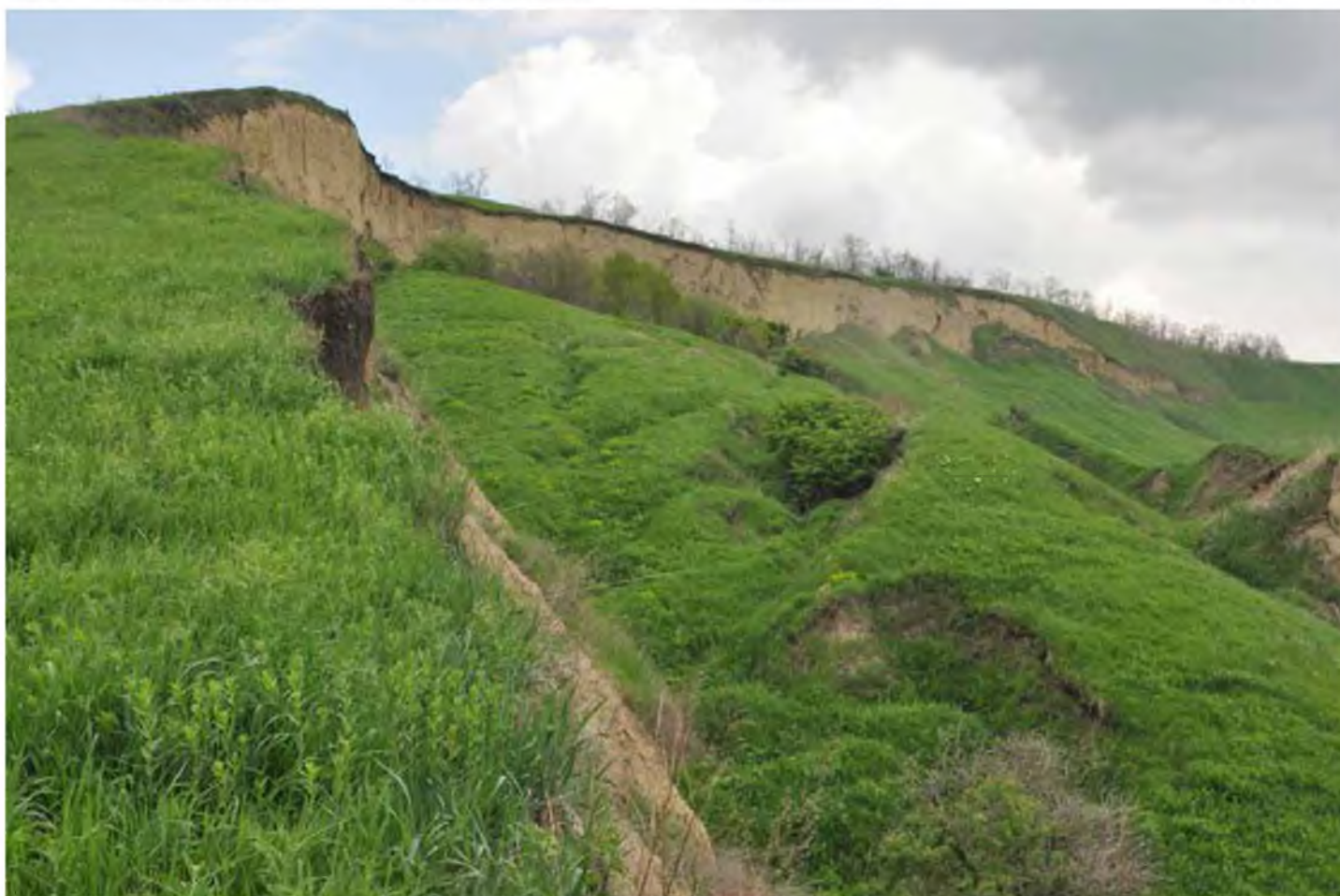
Замляные обрывы в степи