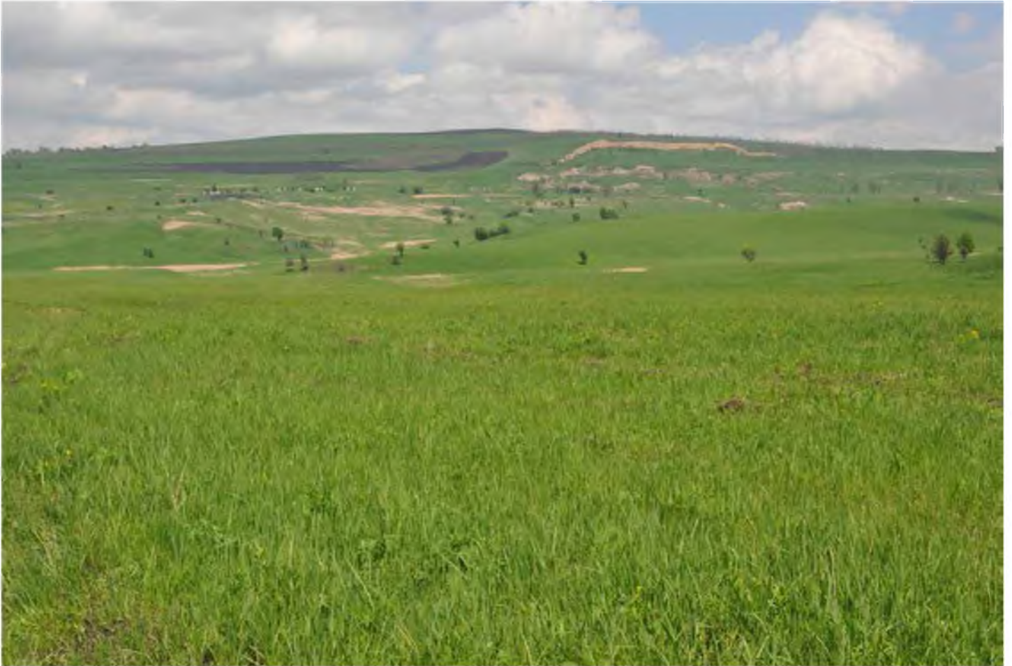
Степь с луговыми участками, балками с тростником, пахотными полями