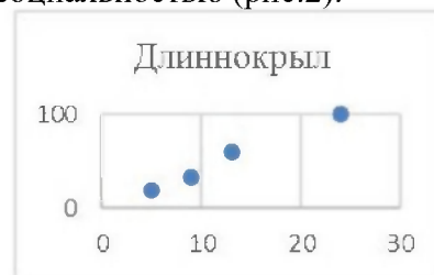
Рис.2. Зараженность эктопаразитами длиннокрылов (Y-%) в связи с их количеством на убежище (X-ос.).

Установленная линейная зависимость зараженности и численности длиннокрылов в убежище связана с их высокой социальностью (рис.2).