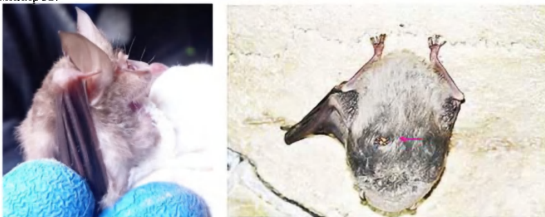
Рис. 5. Южный подковонос и длиннокрыл с кровосоской.

Последнее обследование колонии южного подковоноса ( Rhinolophus euryale BLASIUS, 1853, (рис. 5) в пещ. Мордвиновская выявило высокий уровень интенсивности зараженности всеми эктопаразитами, в особенности, кровососками (интенсивность зараженности = 2.8 \pm 0.1 ). На одной особи было отловлено даже 10 экземпляров.