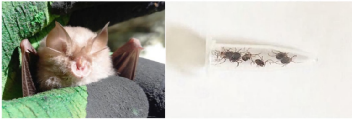
Рис. 1. Малый подковонос и собранные для определения клещи.

Большие подковоносы более социальны, что выражается у них даже в коллективной охоте и богатом спектре социальных сигналов, обнаруженных в материнских колониях (Andrews, Andrews 2003).