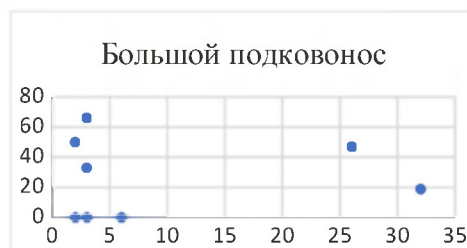
Рис. 3. Зараженность эктопаразитами большого подковоноса (Y - %) в связи с их количеством на убежище (X -ос.).

У больших подковоносов такой явной линейной зависимости не наблюдается (рис. 3), хотя группируемость у них в крупные компактные скопления проявляется более явно в самую холодную часть года.