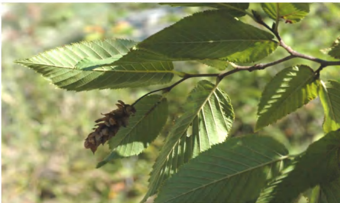
Рис. 2. Соплодие Ostrya carpinifolia – Армения, окр. пер. Тас.