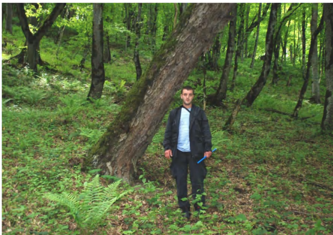
Рис. 3. Перестойное дерево Ostrya carpinifolia – Армения, Шикахохский заповедник.

Следует отметить, что в экологической характеристике хмелеграба также, как и с ареалом, в литературе приведены противоречивые сведения. Одни авторы [13] указывают на произрастание преимущественно в нижнем горном поясе на высоте до 400 м над ур. м., другие [19] – до 300–500 м, при верхнем пределе в 1800 м над ур. м., либо 1400 м над ур. м. [20], третьи считают [4], что наиболее часто вид встречается на высоте 700–800 м (в Аджарии – 1000 м) и поднимается до 2100 м, где принимает стелющуюся форму роста. По нашим наблюдениям, находки хмелеграба на высотах от 1000 до 1600 м над ур. м. на Западном и Центральном Кавказе не представляют редкости [11]. По современным данным [21], на Северном Кавказе в Карачаево-Черкесии, в Тамском ущелье р. Большая Лаба хмелеграб растет