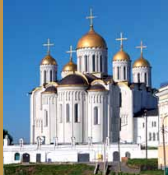
Успенский собор. Владимир