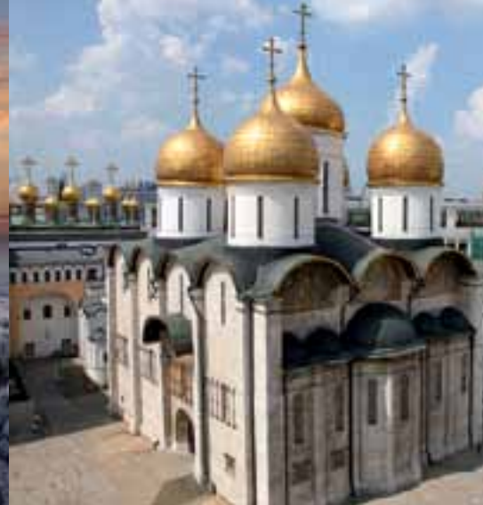
Архангельский собор в Московском Кремле