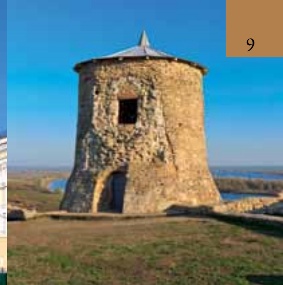
Древняя сторожевая башня на фоне камских просторов. Елабуга

знать через несколько десятилетий – во время революции 1905–1907 годов и последующих «великих потрясений».