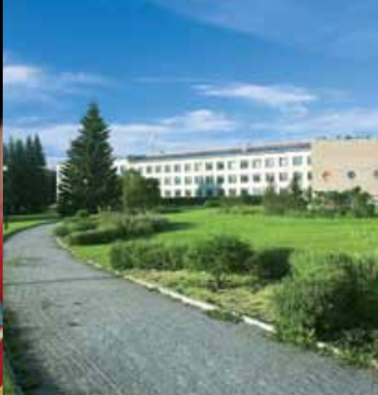
Территория Новосибирского государственного университета