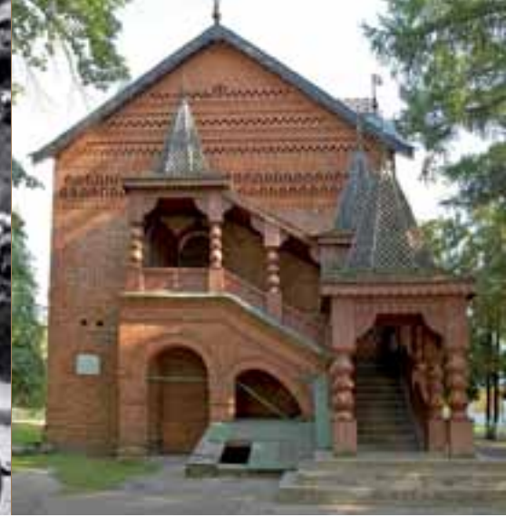
Палаты удельных князей. Углич

(хозяйственное разорение, борьба за рабочие руки и т. п.), но и фундаментальными, непреходящими для феодального социума факторами (такими, как природно-климатические условия, минимальный объем совокупного прибавочного продукта, неизбежность существования общины). В свою очередь, режим крепостничества в России стал возможным лишь при развитии автократических форм государственной власти – российского самодержавия, имеющего глубокие исторические корни. В итоге такого рода «оптимизации» объема совокупного прибавочного продукта режим крепостничества породил и компенсационные (патерналистского типа) механизмы выживания, которые тесно переплетались с общинными механизмами выживания.