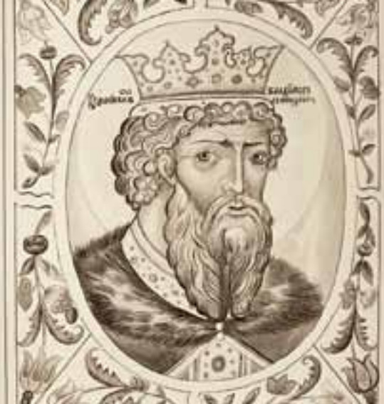
Великий князь Владимир Святославович