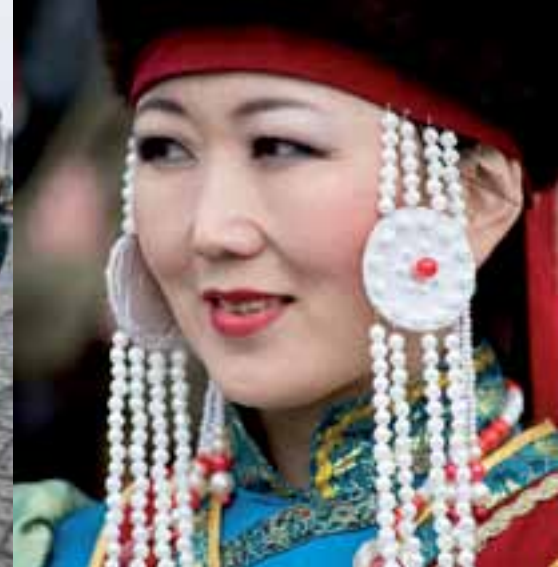
Девушка в бурятском наряде

Наша страна представляет собой нацию наций. Российский народ как нация связан одним государством, общей историей, общей культурой и общими интересами. Именно такой подход определяет сложившуюся структуру, при которой в России есть нации в привычном нам значении слова – русская, татарская, осетинская, чеченская и другие. Их никто не собирается упразднить, переделывать, лишать территориальной или культурной автономии.