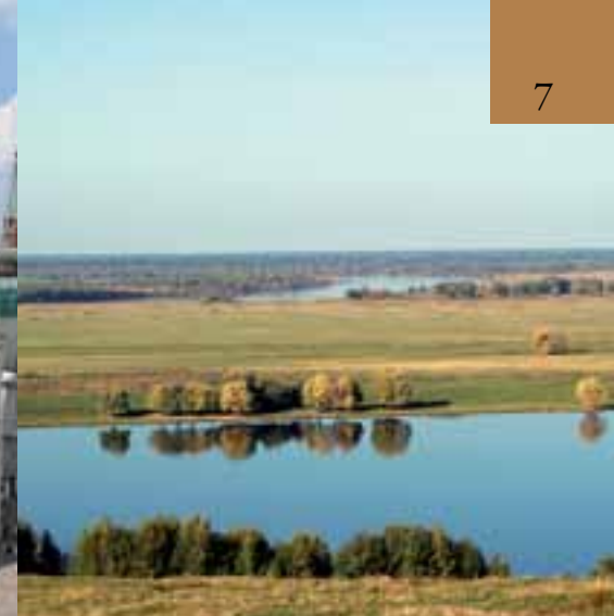
Мещёра, Владимирская область

Евразии. История вполне могла развиваться таким образом, что на Восточно-Европейской равнине существовало бы несколько государственных образований.