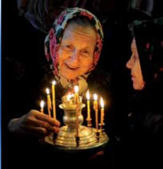
На богослужении в честь празднования Входа Господня в Иерусалим