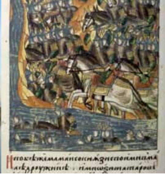
Летописный свод. Куликовская битва