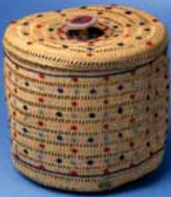
Коробка из стеблей дикой ржи для хранения швейных принадлежностей. Алеуты. Алеутские острова. Конец XIX – начало XX века