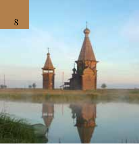
Деревянная шатровая церковь Св. Иоанна Златоуста. Саунино, Архангельская область