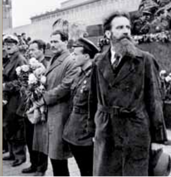
Герои-челюскинцы на Красной площади. 1934 год. На фото справа налево: О.Ю. Шмидт, Н.П. Каманин, В.И. Воронин, В.С. Молоков, А.Н. Бобров