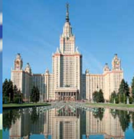
Здание Московского государственного университета им. М.В. Ломоносова