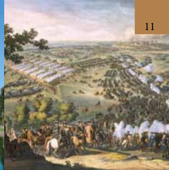
Н. Лармессен. Изображение преславной битвы между русскими и шведскими войсками недалеко от Полтавы 27 июня 1709 года. 1725 год

основу для выработки новой концепции модернизации страны, возвращения стране статуса великой державы. У России есть достаточно возможностей для осуществления модернизации, поскольку в основном удалось сохранить высокий уровень образования населения, ученых и высококвалифицированных специалистов, научно-технический потенциал, сосредоточенный в Российской академии наук и других государственных академиях, государственных научных центрах, исследовательских университетах. Ряд отраслей промышленности сохранили конкурентоспособность на мировых рынках: атомная энергетика, авиация, космическая техника, продукция оборонной промышленности и др.