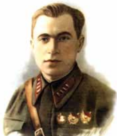
Илья Григорьевич Старинов (1900–2000), выдающийся теоретик и практик партизанской войны