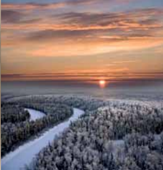
Заснеженная тайга, Сибирь