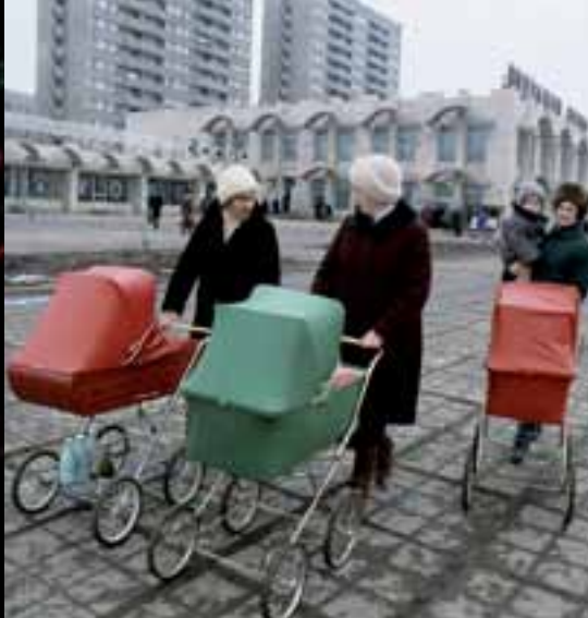
Дети Волгодонска. 1985 год