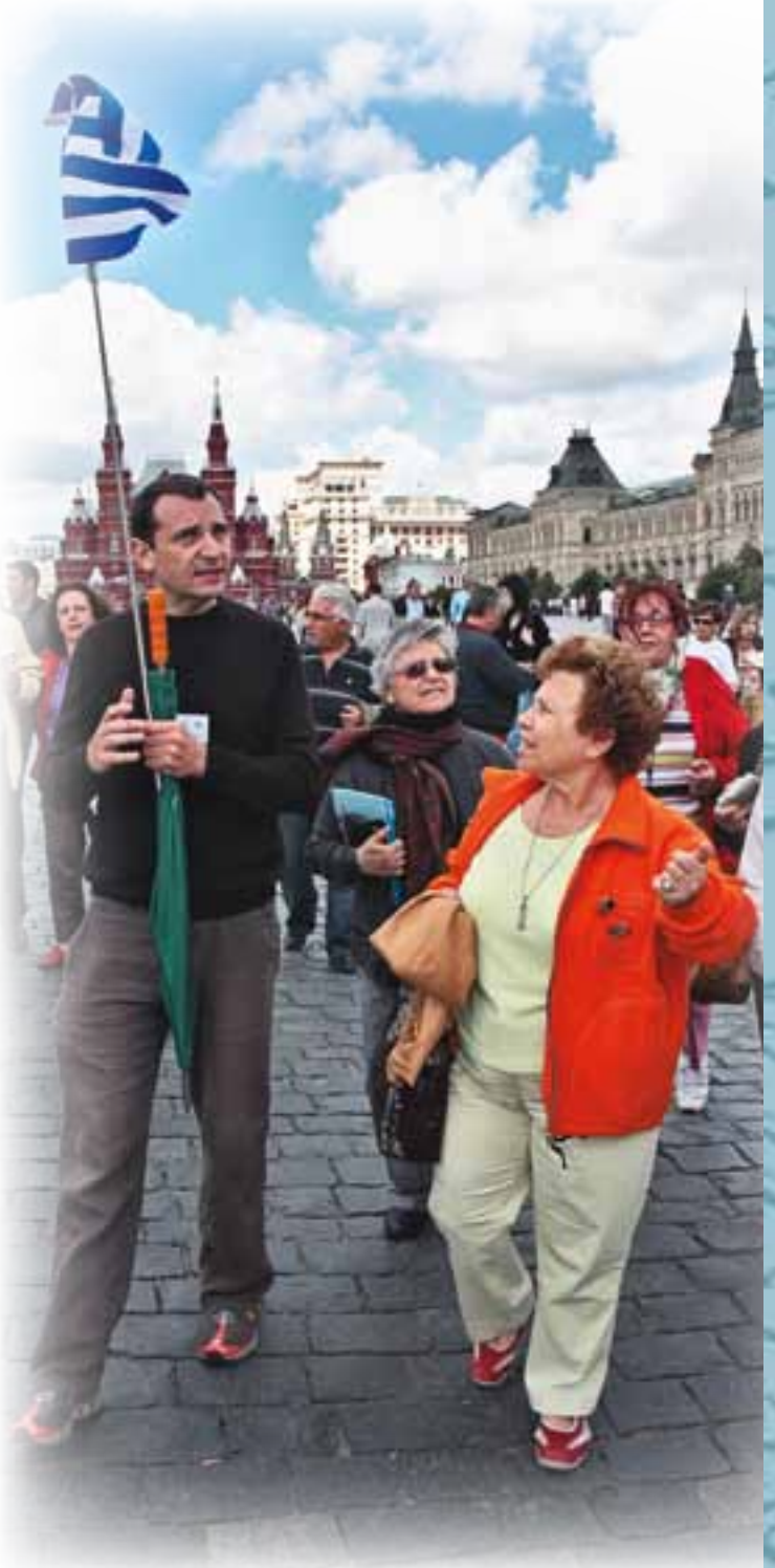
Туристы на Красной площади

менитые природно-культурно-религиозные памятники – Соловецкие острова, Валаамский архипелаг, Кижы. В будущем инновационное предложение включает древнекарельские крепости, форты линии Маннергейма, топонимический маршрут «Голубая дорога» с древнефинскими названиями.