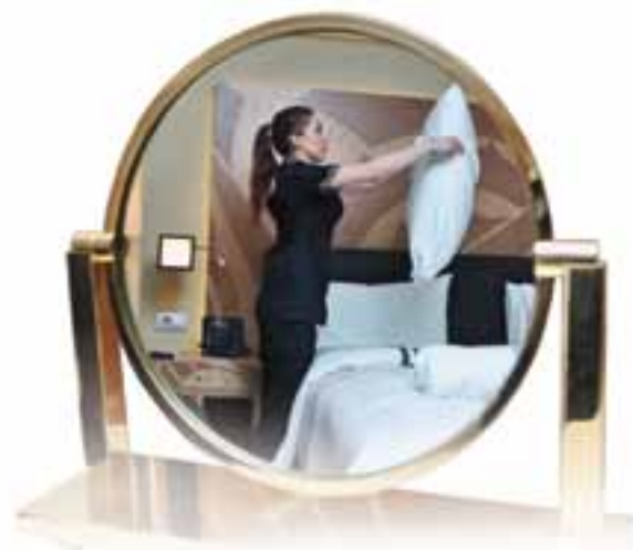
Горничная прибирает номер в отеле. Санкт-Петербург

Некоторые традиционные для России виды туризма являются уникальными в мире, а инновационное развитие российского туризма удовлетворяет потребности в новом знании и новом опыте.