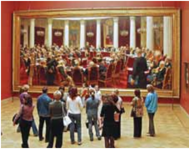
В одном из залов Русского музея перед картиной И.Е. Репина «Торжественное заседание Государственного совета 7 мая 1901 года» в Санкт-Петербурге

Показатели научного и зависящего от него инновационного потенциала России свидетельствуют о необходимости активизации деятельности в секторе научных исследований и разработок.