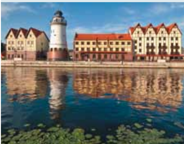
Ремесленно-торговый центр «Рыбная деревня», Калининград

Как сектор экономики индустрия туризма объединяет те виды деятельности, которые непосредственно потребляют туристы, т. е. физические лица, осуществляющие временные выезды (путешествия) с постоянного места жительства и посещающие место временного пребывания на период от 24 часов (с не менее чем одной ночевкой в месте временного пребывания) до 6 месяцев подряд (до 1 года – согласно правилам международной туристской статистики) в любых целях за исключением посещения места временного пребывания с целью получения дохода.