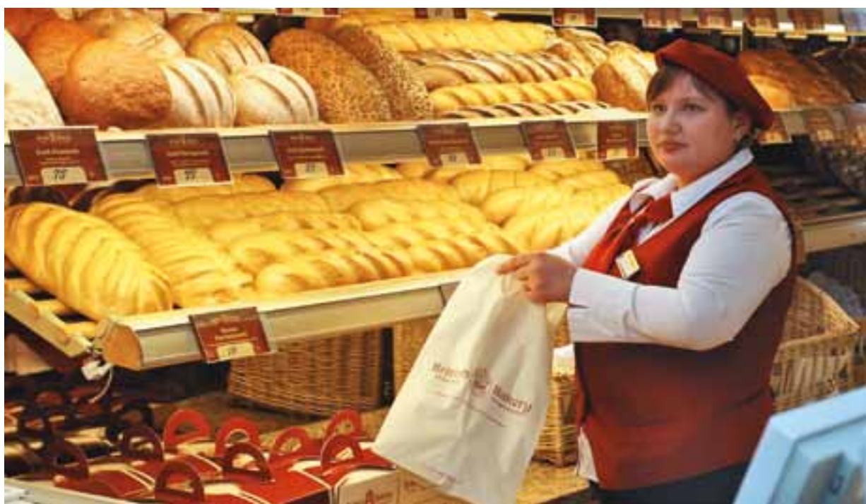
В кофейне-кондитерской. Санкт-Петербург

В докладе экспертов ОЭСР «Tourism Trends & Policies» отмечается, что в течение 20 лет, предшествовавших кризису, туризм развивался быстрее глобальной экономики. В последние пять докризисных лет число туристских поездок росло в среднем на 7,1%. Для мировой экономики туризм более значим, чем сельское хозяйство, лесное и рыбное хозяйство, и почти столь же важен, как производство и распределение электро- и теплоэнергии, газа и воды. Считается, что сейчас доля туризма в ВВП составляет 2,6–2,8%, а с учетом мультипликативного эффекта – 10–11%. Эксперты ОЭСР прогнозируют сохранение опережающего роста туризма в долгосрочной перспективе.