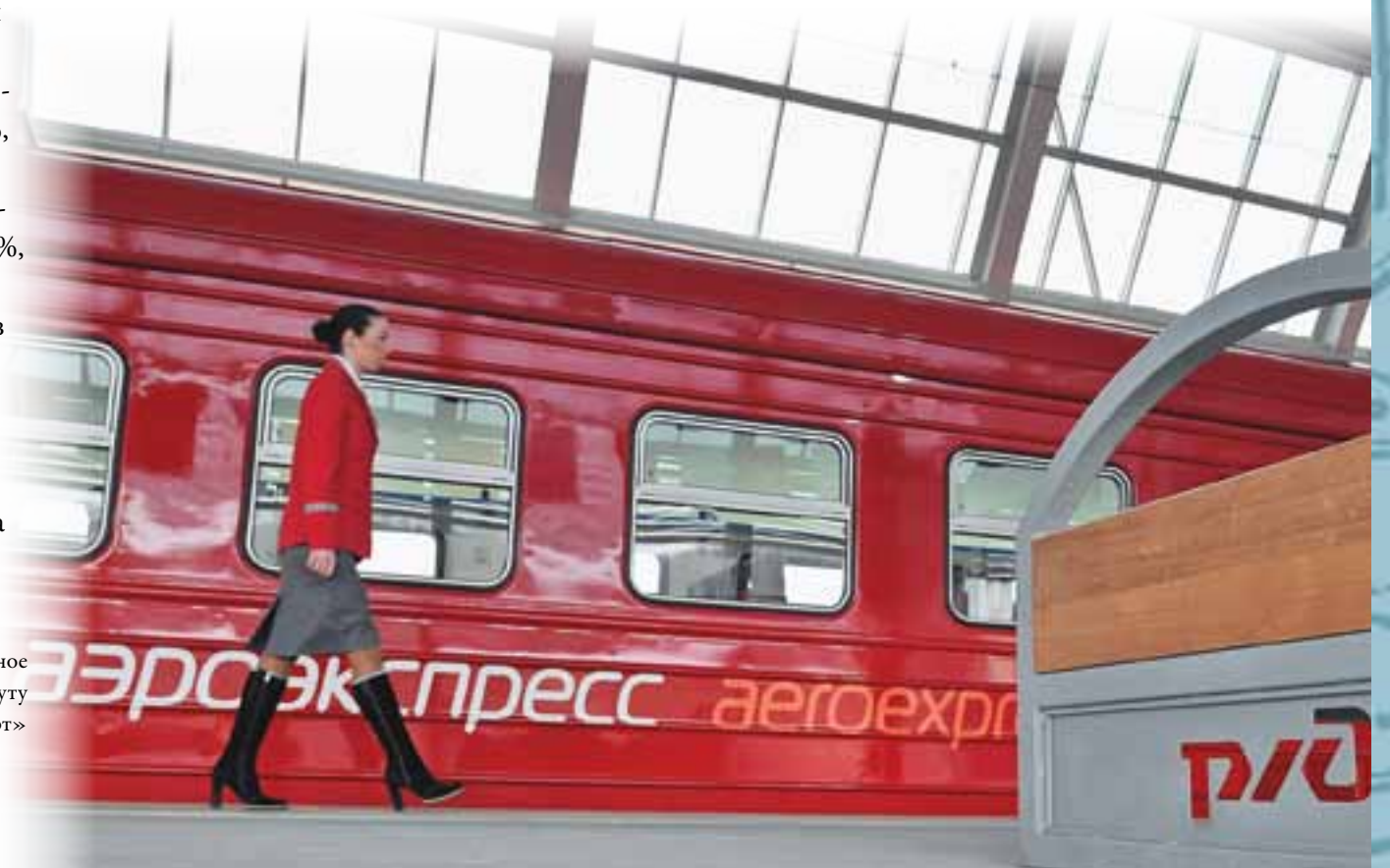
Аэроэкспресс на платформе терминала. Открыто регулярное железнодорожное пассажирское сообщение по маршруту «Сочи–Адлер–аэропорт»

По другим видам услуг сложился отрицательный платежный баланс. Наибольшее превышение импорта над экспортом услуг приходится на личные (туристские) поездки: в 2010 году импорт туристских услуг – услуг, оказанных российским туристам на территории иностранных государств, – составил 24 706 млн долл., а экспорт туристских услуг – услуг, оказанных иностранным туристам на территории России, – 3875 млн долл.