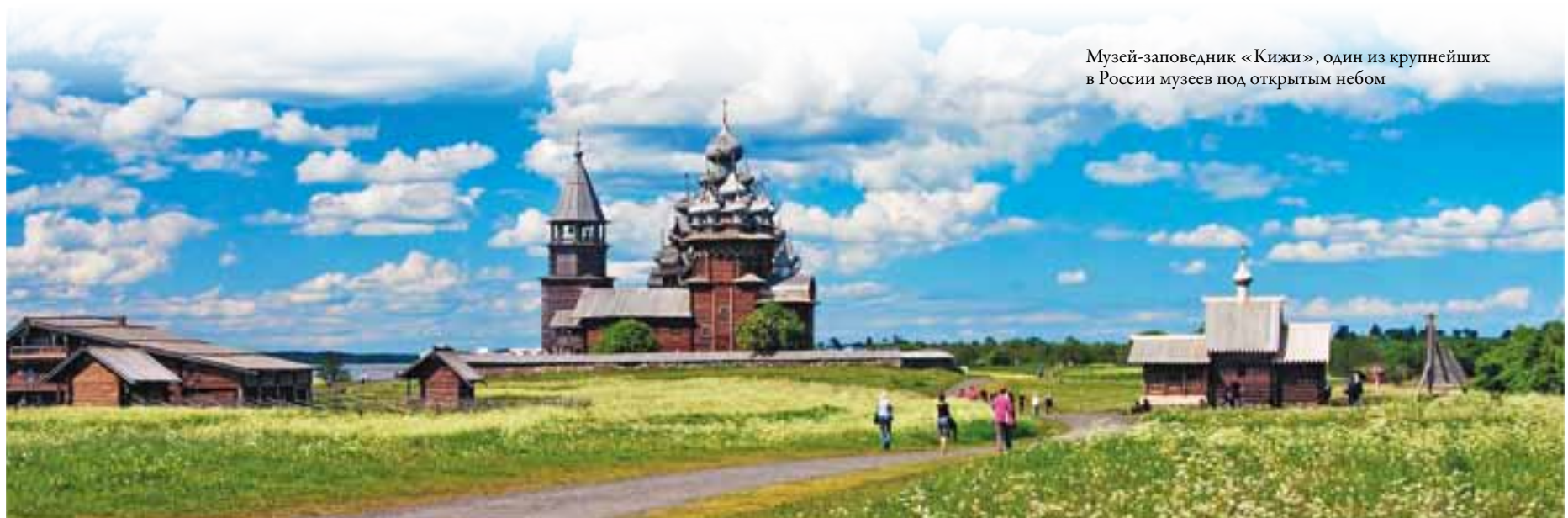
Музей-заповедник «Кижский», один из крупнейших в России музеев под открытым небом

Москва, отчасти Санкт-Петербург, с одной стороны и семь федеральных округов с другой демонстрируют существенность различий. Если объем услуг, оказанных за плату населению Москвы, в пересчете на душу населения в доперестроечном 1990 году в 2 раза превышал объем платных услуг, приходящийся на душу населения России в целом и каждого федерального округа в отдельности, за исключением Дальневосточного округа, то в 2000, 2005 и 2009 годах по сравнению со среднероссийским уровнем это превышение составляло 4,4 раза, 3,3 и 2,8 раза соответственно, а по сравнению с минимальным уровнем, сложившимся в округах, – 7,2 раза, 4,7 и 3,9 раза соответственно.