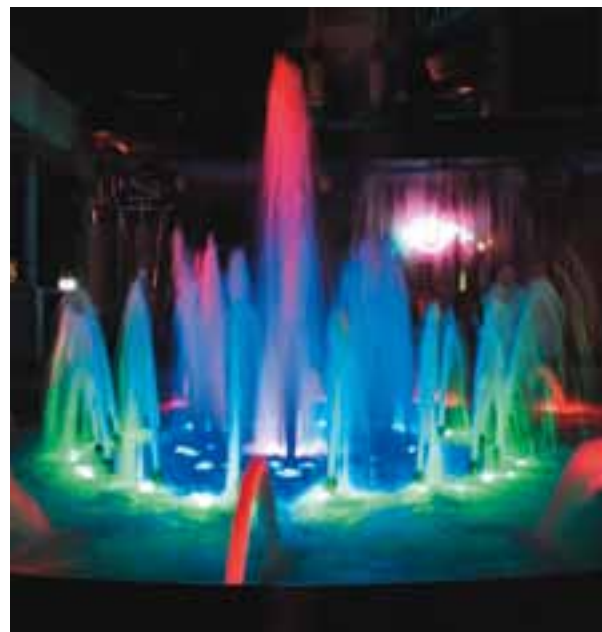
Пьющий фонтан, Сочи

Теми или иными видами рекреационно-туристских ресурсов обладают практически все регионы России, однако уровень развития туристской инфраструктуры и степень использования туристского потенциала существенно различаются по регионам.