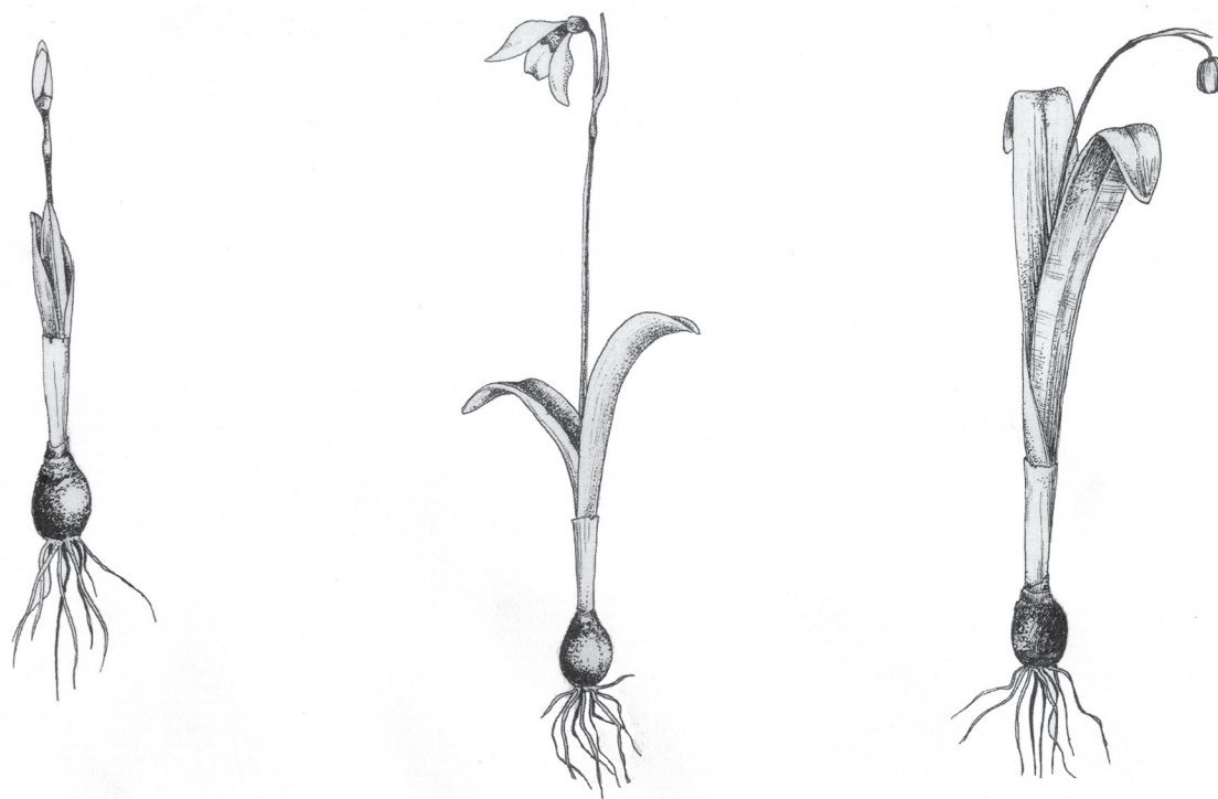
Рис. 5 / Fig. 5. Вид Galanthus woronowii в фенологические фазы бутонизации, цветения и плодоношения (автор И. Н. Тимухин, см. Timukhin, Tuniyev, 2002).

70,8 пг у G. woronowii и 56,14 пг у G. lebedevae (см. ниже в обсуждении) (табл.).