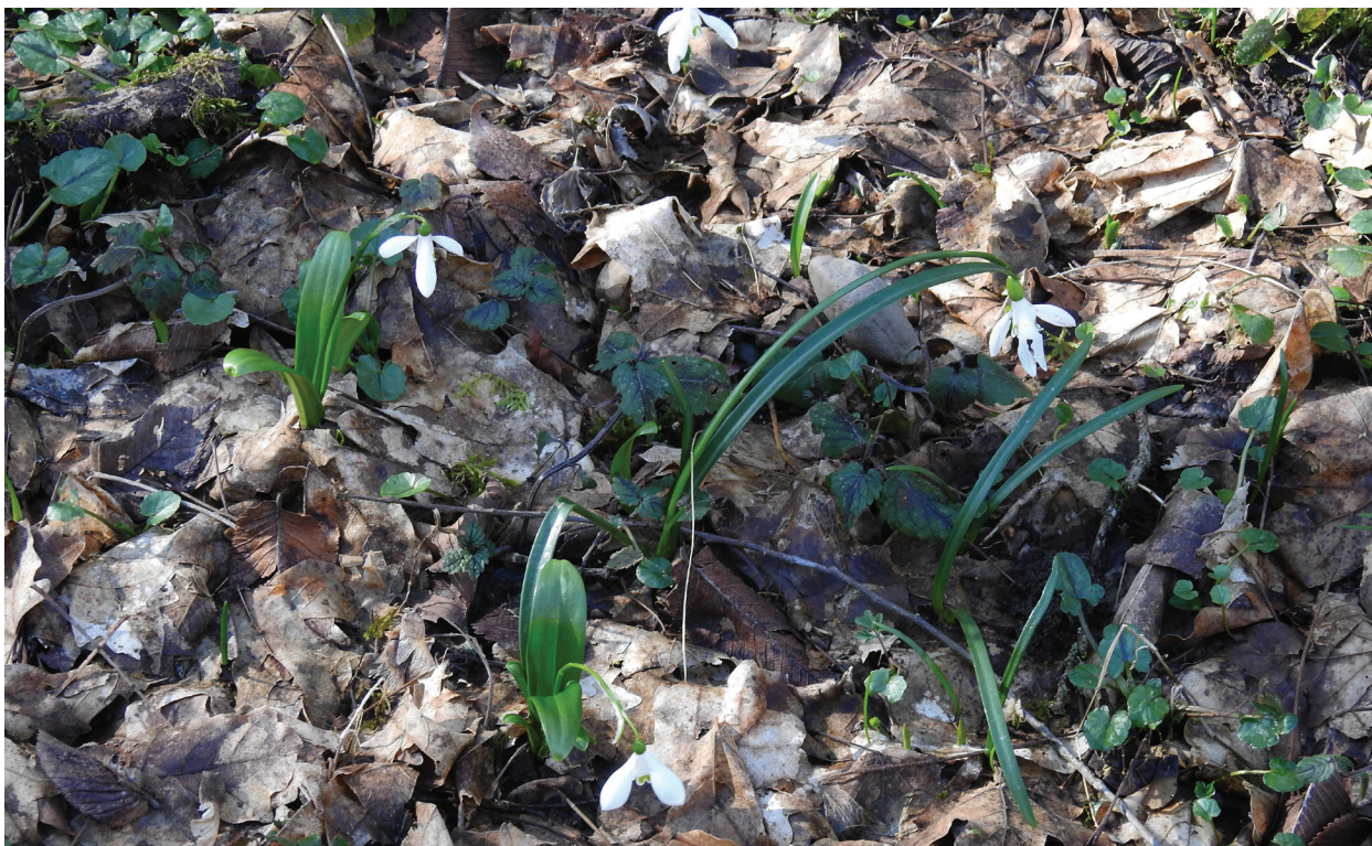
Рис. 7 / Fig. 7. Пример синтопии различных представителей рода Galanthus в окр. г. Сочи: G. woronowii и G. rizehensis в долине р. Псезуапсе, окр. с. Марьино.

ственных окр. пос. Красная Поляна известняковые скалы расположены на высотах, превышающих 1000 м над ур. м., и удалены как от предгорий (ареала G. lebedevae ), так и не совпадающие с высотным распространением G. lebedevae до 300 м над ур. м. Укажем, что даже сам пос. Красная Поляна расположен на высоте 550 м над ур. м. Таким образом, следует признать, что указанные в литературе данные о содержании ядерной ДНК у G. woronowii 56,3(56,2) пг (Zonneveld et al., 2003; Zubov, Davis, 2012) в действительности относятся к G. lebedevae . Возможно, это объясняется тем, что большинство анализированного материала, исходя из табл. 1, в статье В. J. M. Zonneveld et al. (2003) происходило из культуры, либо было получено в виде луковиц от третьих лиц, в том числе с неправильным определением. Явно реликтовый дизъюнктивный ареал G. lebedevae , сохранившегося в небольшом количестве предгорных известняковых каньонов, способствовал сохранению в северокавказском рефугиуме древнего вида с диплоидным набором хромосом и содержанием ДНК 56,14 пг. Более молодой, предположительно, также диплоидный вид G. woronowii (с содержанием ДНК 70,8 пг), согласно нашим гербарным сборам, достаточно широко распространен вдоль всего Западного