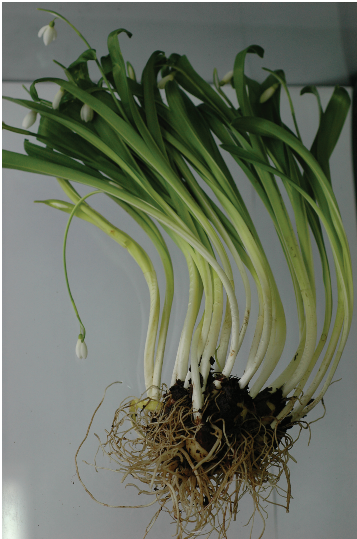
Рис. 2 / Fig. 2. Клон Galanthus lebedevae из Ахштырского ущелья (locus classicus), характерная пропорция длины листьев и цветоноса в фазу цветения.