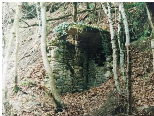
Рис. 6. Сохранившиеся стены тайного Покровского монастыря игуменьи Антонины в урочище Шулюк (ныне Лазаревский район Сочи)

часовни на правом берегу реки. От здания сохранилась упирающаяся в возвышающийся над небольшой террасой крутой западный склон узкая ниша из дикого камня, на известковом растворе, со сводчатым перекрытием (Рис. 6). На остальной площади прослеживается фундамент небольшого помещения площадью примерно 3 x 3 метра.