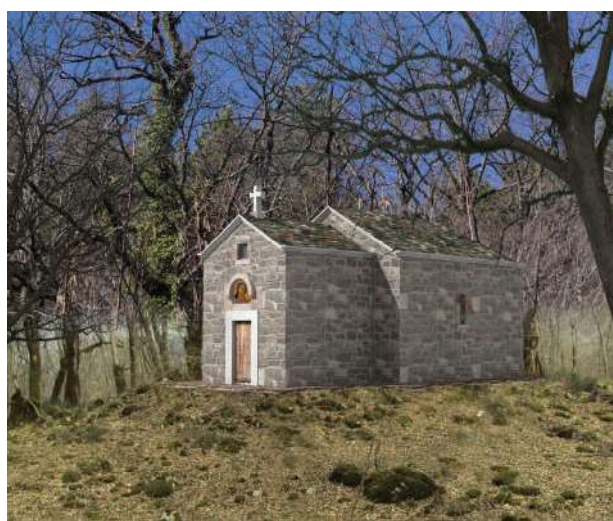
Рис. 3. Графическая реконструкция храма у с. Галицыно. Выполнена архитектурным бюро «Ас про» (Ф. И. Афуксениди)

Монахи использовали руины стен крепости для устройства своих келий. Об этом говорят остатки вырытых в разных местах горного уступа квадратных или прямоугольных углублений под землянки с каменными развалами около них. Несохранность объясняется тем, что здесь в свое время активно орудовали «черные копатели» [5].