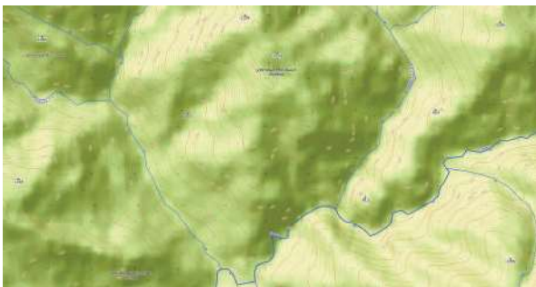
Рис. 4. Географическая карта урочища Монашья Поляна на правом берегу реки Сочи с местами впадения ее притоков

Если местечко Монашка в районе селения Лесное, к сожалению, не обозначено на топографических картах, то территория среднего течения реки Сочи имеет сразу несколько названий, связанных с монашеством. В ее приток, реку Агву, впадает речка Большая Монашка, на левом берегу которой находится урочище Монашья Поляна. Выше по течению реки Сочи, ближе к истокам, есть еще одно урочище с таким же наименованием. Причем расположено оно между двумя ее притоками: Монашкой Первой и Монашкой Второй (Рис. 4).