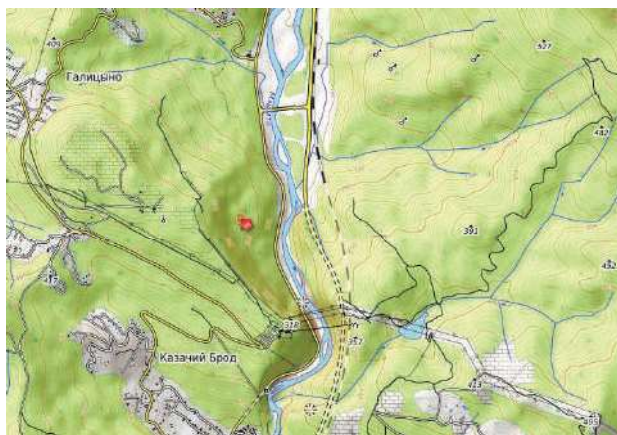
Рис. 1. Географическая карта местности на правом берегу реки Мзымты, между посёлками Галицыно и Казачий Брод, с местом возможного размещения монашеской обители

После того, как церковная жизнь в селении более или менее наладилась, появилась возможность устройства монашеской обители. Для нее выбрали место на восточном склоне горного хребта, хорошо подходившего для этой цели. Это местечко на правом берегу реки Мзымты по дороге на Красную Поляну, ставшее монашеской обителью, до сих пор называют Монашка (Рис. 1) [5, с. 33].