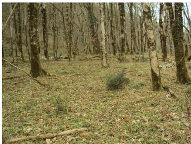
Рис. 2. Плоский горный уступ, на котором предположительно размещалась монашеская обитель

Плоский горный уступ площадью 60 x 60 квадратных метров упирается в крутой склон хребта. Такие участки — с хорошим обзором и удобные в защите — в древности люди выбирали для устройства крепостей в горной местности (Рис. 2). И такое укрепление в Средние века здесь действительно существовало. Оно предназначалось для защиты жившего тогда поблизости христианизированного населения, молившегося в построенной на правом берегу Мзымты однефной базилике (Рис. 3).