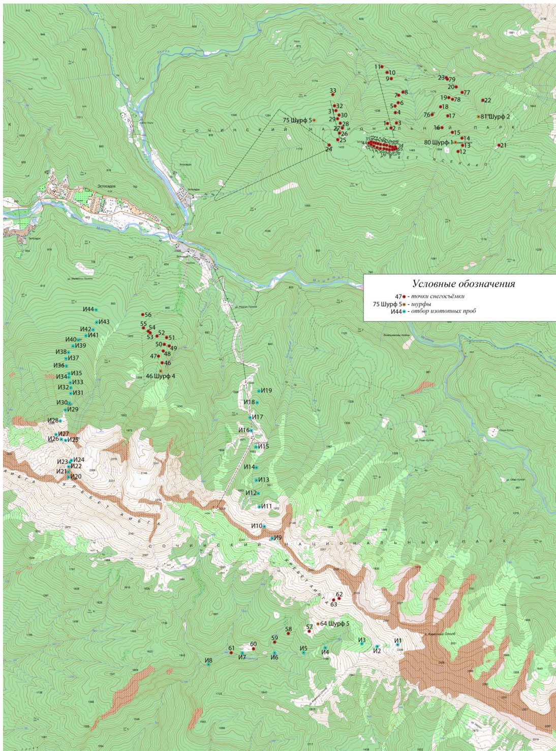
Рисунок 1 – Район проведения работ