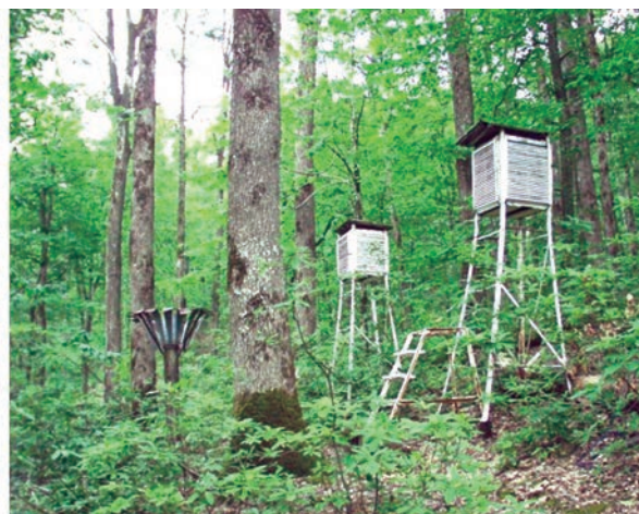
Рис. 5. Наблюдения за микроклиматом на метеоплощадках ЛГС “Горский”.