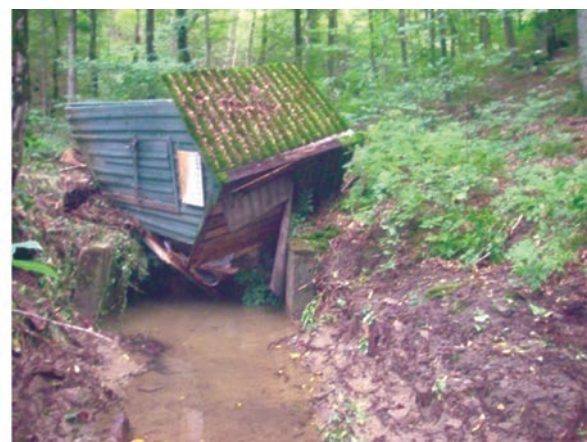
Рис. 6. Слева — водослив на гидрометрическом посту 3-го ручья ЛГС “Горский”. Справа — повреждения поста после катастрофического паводка в 2001 г.

проведения рубки очень медленно приближался к 1. Инфильтрационная часть водного баланса в 3 раза меньше, чем на контрольном водосборе. Поступление влаги в глубокие горизонты почвогрунтов уменьшается до 65 мм в год за счет возрастания быстрого склонового стока (при годовом количестве осадков 1300–1700 мм). При этом здесь характерны большие величины объемов и коэффициентов стока паводков, составляющих в среднем около половины всех выпадающих осадков. В холодный период года основная часть паводков имеет коэффициенты стока, равные 90–98%.