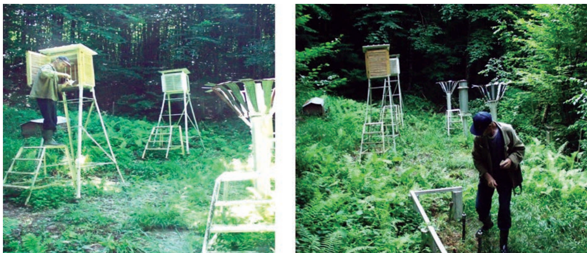
Рис. 3. Метеорологические наблюдения на метеоплощадках в лесу – ЛГС “Аибга”.