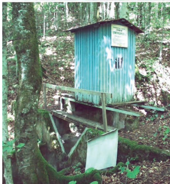
Рис. 2. Гидрометрические посты на 2-ом и 4-ом ручьях ЛГС “Аибга” для учета ручьевого стока с помощью самописцев (оригинальная конструкция водосливов разработана авторами).

ки, наносящие значительный урон сооружениям ЛГС. Так, во время выпадения на ручьях ЛГС “Горский” в июне 2001 г. смерчевых осадков произошли разрушения гидрометрических сооружений на водосборах № 2 и № 3. После интенсивных осадков, превышающих 225 мм за 2 ч, образовались паводки исключительно редкой повторяемости. Так, на водосборе № 3 расчеты максимального паводка по меткам высоких вод дали величины скорости потока 10.3 м/с и 9.08 м/с., что соответству-