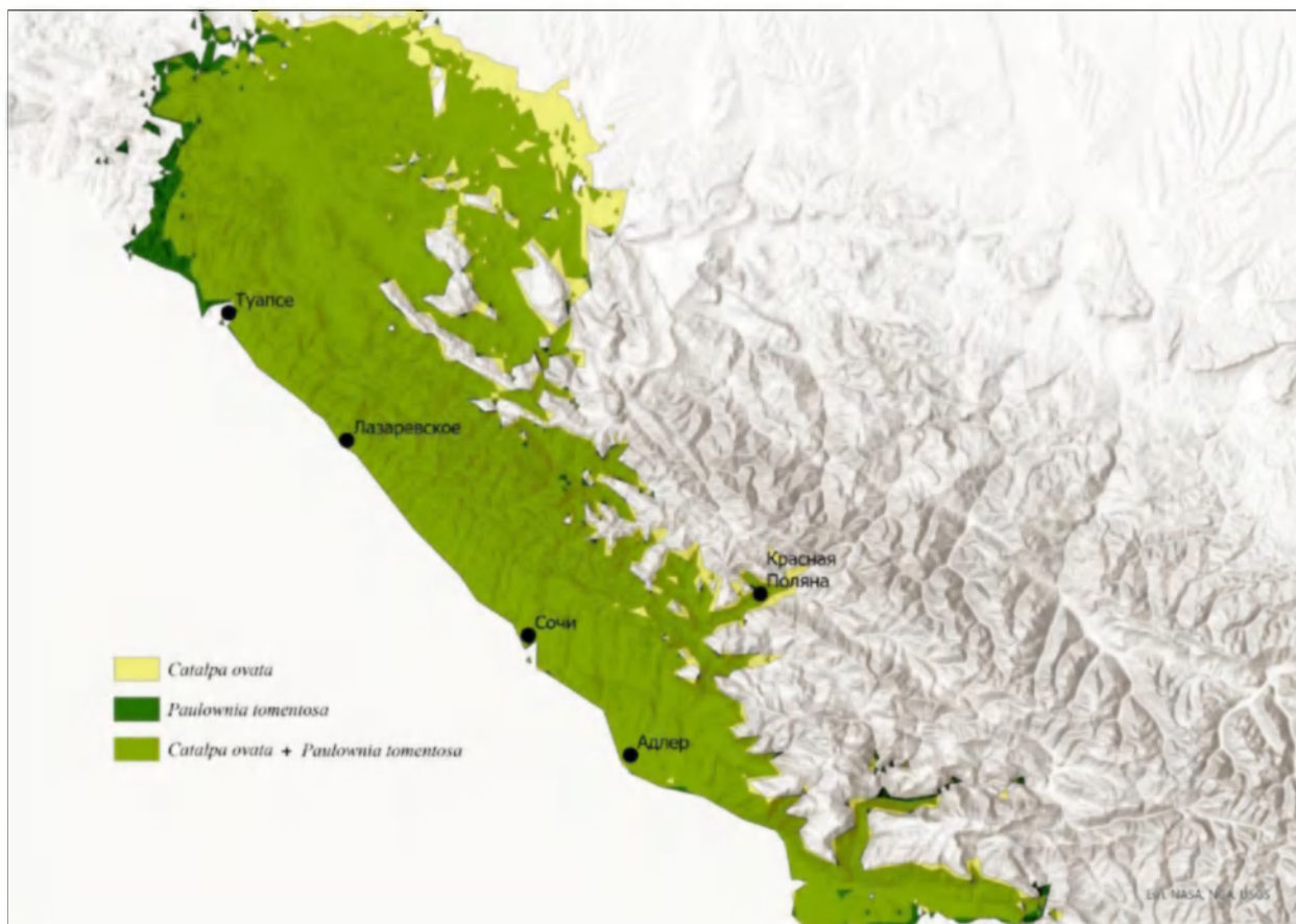
Рис. 2. Карта пригодности мест произрастания Paulownia tomentosa и Catalpa ovata на юге Российского Причерноморья, построенная с помощью моделирования методом максимальной энтропии.

Из всех переменных среды, годовая сумма осадков и солнечная радиация внесли наибольший вклад в результаты моделирования пространственного распределения как Paulownia tomentosa , так и Catalpa ovata (табл. 2).