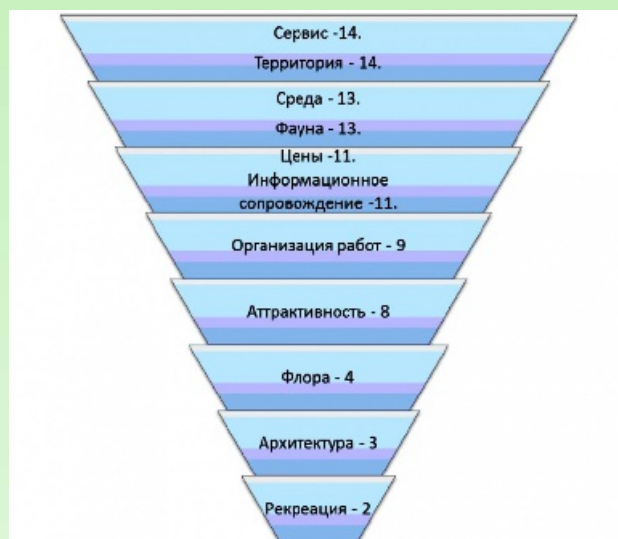
Рис.2. Встречаемость факторов, оцениваемых в отрицательных отзывах