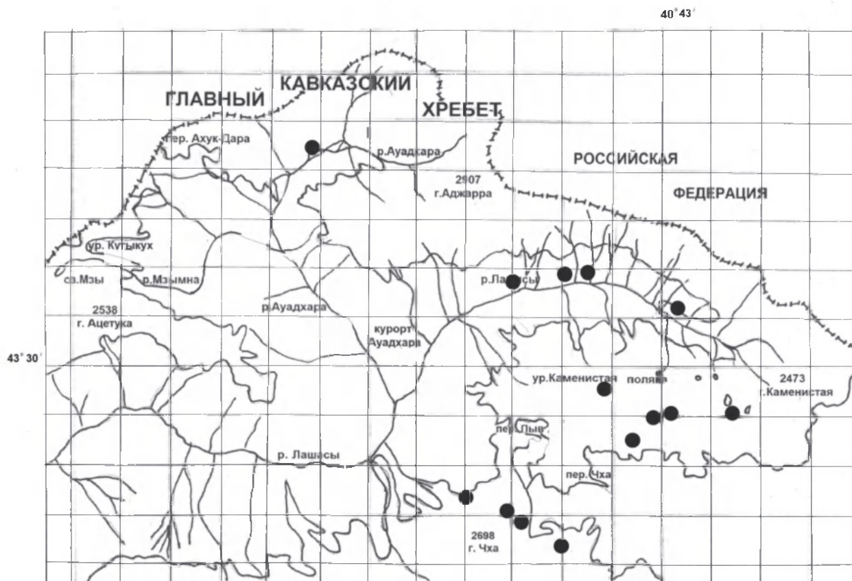
Рис. 1. Локализация описаний на территории РРНП

пийских лугов и полей Западного Кавказа. Сообщества ассоциации впервые были описаны на территории ТГБЗ (Onipchenko, 2002). Позже подобные сообщества были выявлены на территории СНП (Ескина, 2006). В настоящей работе сообщества ассоциации впервые описываются на территории РРНП. По своей структуре и флористическому составу сообщества можно отнести к группе разнотравных субальпийских лугов в понимании А. А. Гроссгейма (1948).